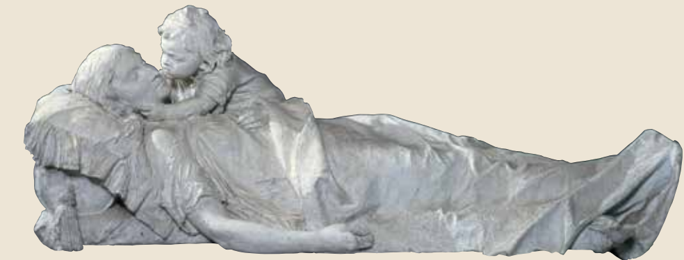
Andrea Malfatti, Donna morta e bambino che la bacia - 1890